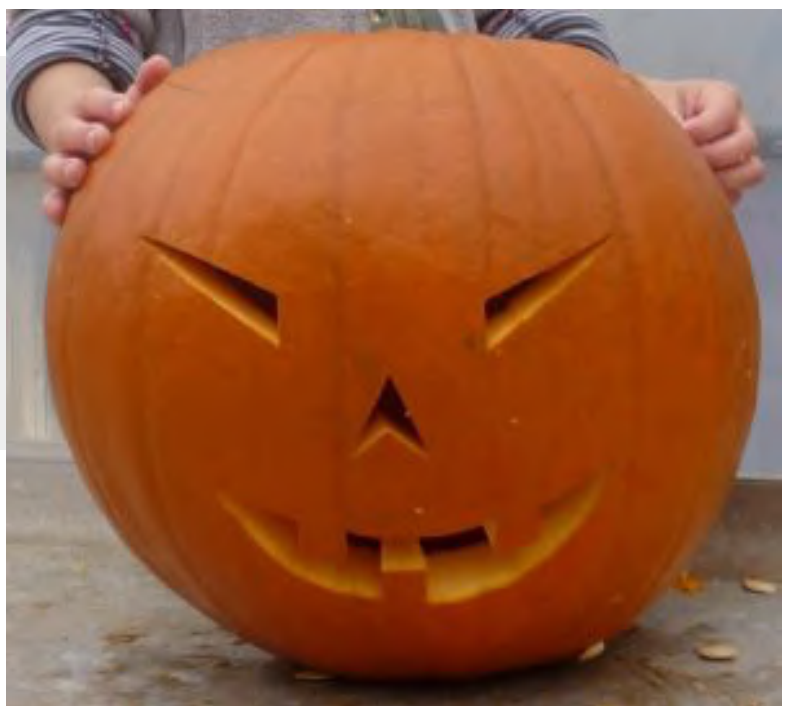
Stolz präsentieren Kinder und Konfis ihre Schnitzkürbisse

Beim anschließenden Kürbisschnitzen hatten Konfis, Kinder und ganze Familien sehr viel Spaß, wie man an dem nebenstehenden Beispiel sehen kann.