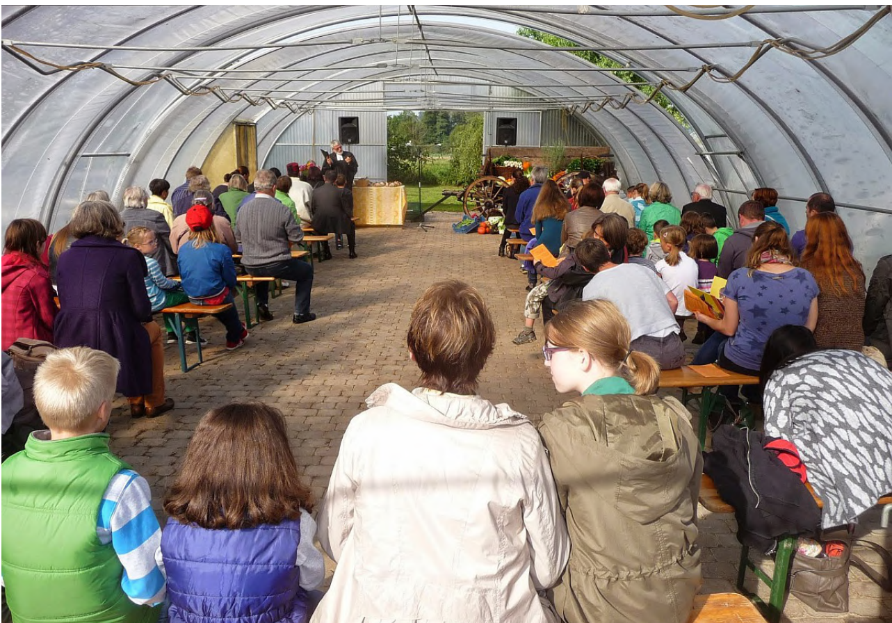
Die interreligiöse Feier zum Erntedankfest war auch im zweiten Jahr gut besucht

Gott etwas opfern, wie macht man das? Als das Volk Israel noch einen Tempel hatte, wurden dort Tiere geschlachtet oder Früchte vom Acker als Opfer verbrannt. Damit wollte man entweder Gott um Vergebung bitten für böse Dinge, die man getan hatte. Oder man wollte Gott zeigen, wie dankbar man war, und gab ihm etwas von dem zurück, was er einem geschenkt hatte. Dabei ist oft das Fleisch von dem Opfer armen Menschen gegeben worden oder man hat es gemeinsam bei einem Fest gegessen. Man tat also etwas Gutes, man teilte miteinander, man hielt richtig gut zusammen.