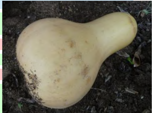
Dieser Kürbis stellte im Spiel der Konfis das fremdartige Gemüse dar

Elisa: Und vor allem: Danke, Gott, dass du uns genug zu essen gibst. Lass uns das Essen mit Freude teilen!