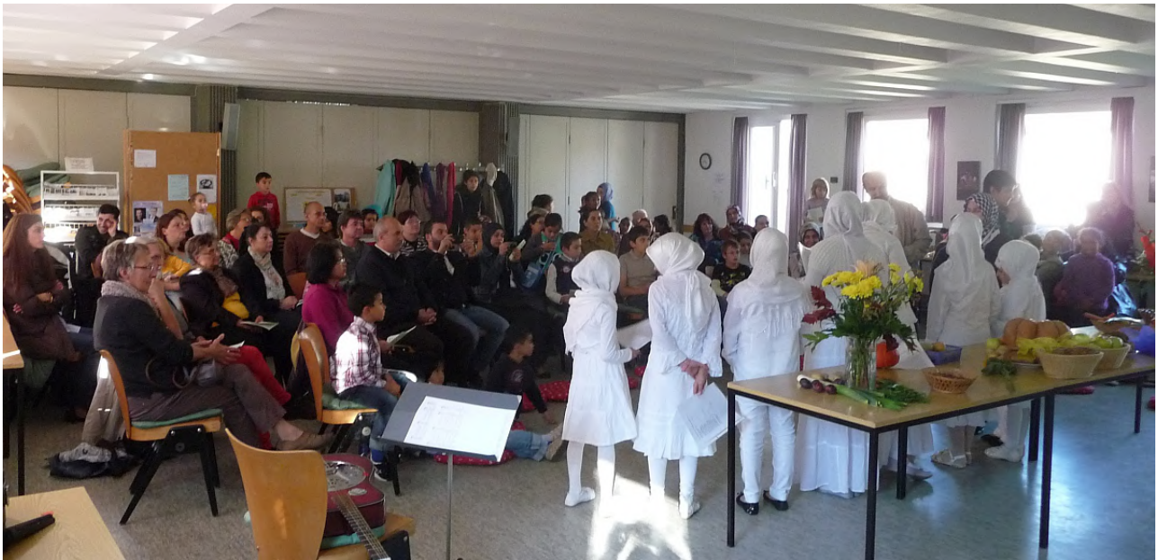
Der Kinderchor der Türkisch-Islamischen Gemeinde trug Lieder zur Interreligiösen Feier bei