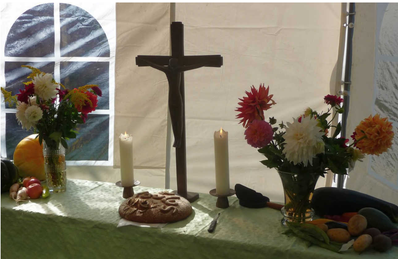
Erntedankfestaltar im Zelt der Gartenfreunde am Waldbrunnenweg

Jesus sagt einen ganz schrägen Satz: „Dieses Brot ist mein Fleisch, das ich geben werde für das Leben der Welt.“ Behandelt mich wie ein Beutetier. Fresst mich auf, kreuzigt mich, macht mich zu Matsch, beleidigt mich und meine Mutter, ich schla-ge nicht zurück. Im Koran redet Abel so zu Kain: „Auch wenn du mich tötetest, ich werde dich nicht töten.“