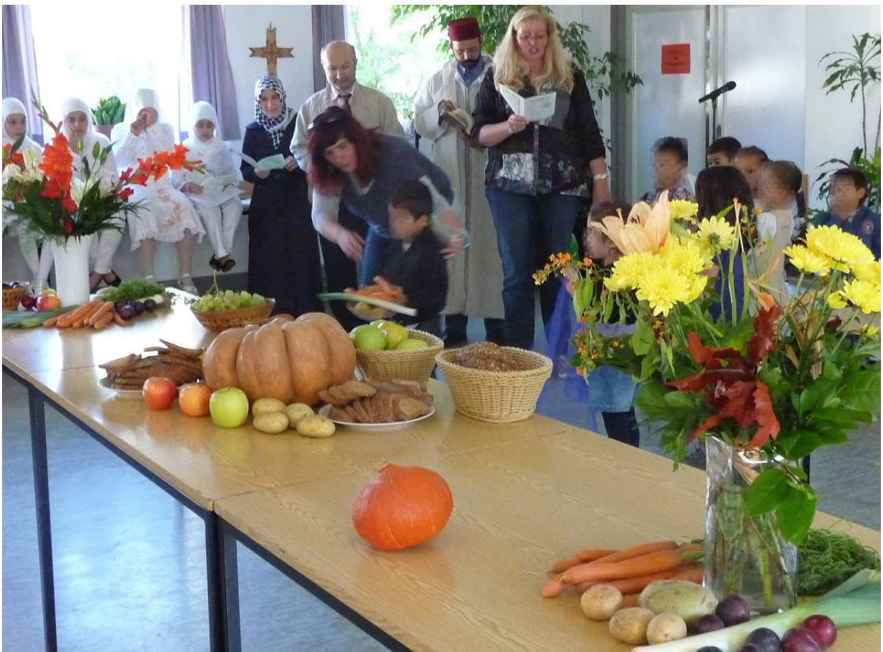
Die Kinder der Paulus-Kita schmückten im Gemeindesaal den Erntedanktisch

Im Jahr 2012 wird das Erntedankfest im Saal der Evangelischen Paulusgemeinde Gießen interreligiös gefeiert. Kindergartenkinder decken den Erntedanktisch, ein Kinderchor der Türkisch-Islamischen Gemeinde singt ein Danklied für die Schöpfung, und eine Beamerpräsentation: „Schöpfungstage“ nach der Bibel und dem Koran wird gezeigt.