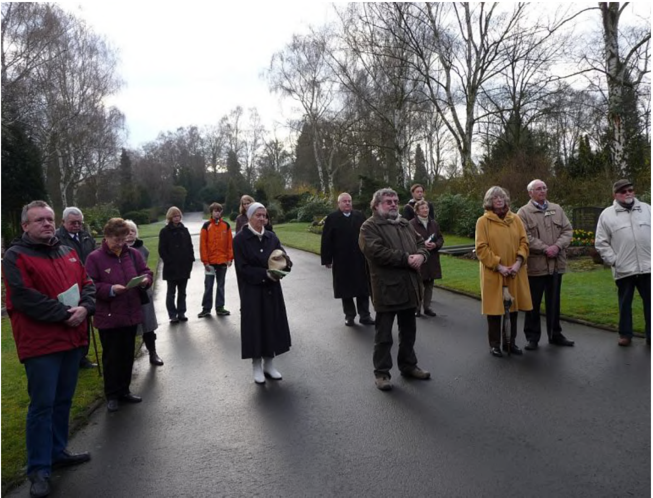
Teilnehmende an der Osterandacht am Steinkreuz um 8 Uhr am Morgen des Ostersonntags

13 Herr, unser Gott, es herrschen wohl andere Herren über uns als du, aber wir gedenken doch allein deiner und deines Namens.