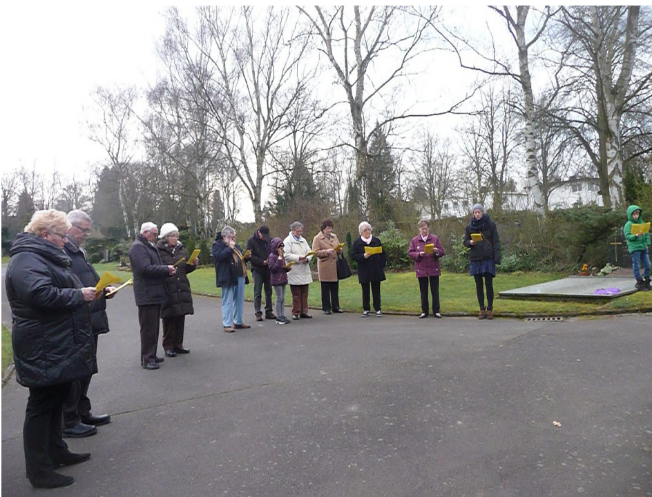
Teilnehmende an der Osterandacht 2016 beim gemeinsamen Gesang

ist Kephas der erste Zeuge, das ist der aramäische Name des Chef-Apostels Petrus. Weiter nennt er die Zwölf, womit er die Gesamtheit der Jünger Jesu meint; genau genommen hätte er Judas in dieser Zahl ja nicht mitrechnen dürfen. Dann berichtet er von mehr als 500 Brüdern auf einmal; bei denen ist ihm wichtig, dass man viele von ihnen noch befragen kann, weil sie noch leben. Übrigens können unter diesen 500 auch bei Paulus Frauen gewesen sein, denn das griechische Wort „adelphoi“ kann Brüder und auch Geschwister bedeuten. Schließlich erwähnt er noch Erscheinungen des auferstandenen Jesus vor Jakobus und allen Aposteln und ganz zum Schluss auch vor ihm selbst.