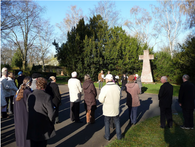
Versammelte Gemeinde unter blauem Himmel am Steinkreuz auf dem Friedhof in Gießen

also Misstrauen, Selbstsucht, Lüge, Korruption verdorben ist, ist nicht aufnahmefähig für die Unverdorbenheit der Liebe, der Hoffnung, des Gottvertrauens, aus denen Gottes Himmel besteht. Es sei denn, Gott zerstört die Macht dieser Verdorbenheit und öffnet uns den Weg zur Unverdorbenheit.