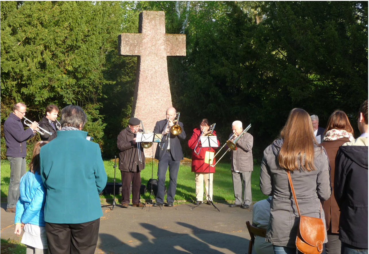
Zum ersten Mal wurde die Osterandacht am Steinkreuz ökumenisch gefeiert

Und nun beginnen wir unsere Osterfeier im Namen Gottes, des Vaters und des Sohnes und des Heiligen Geistes. Amen.