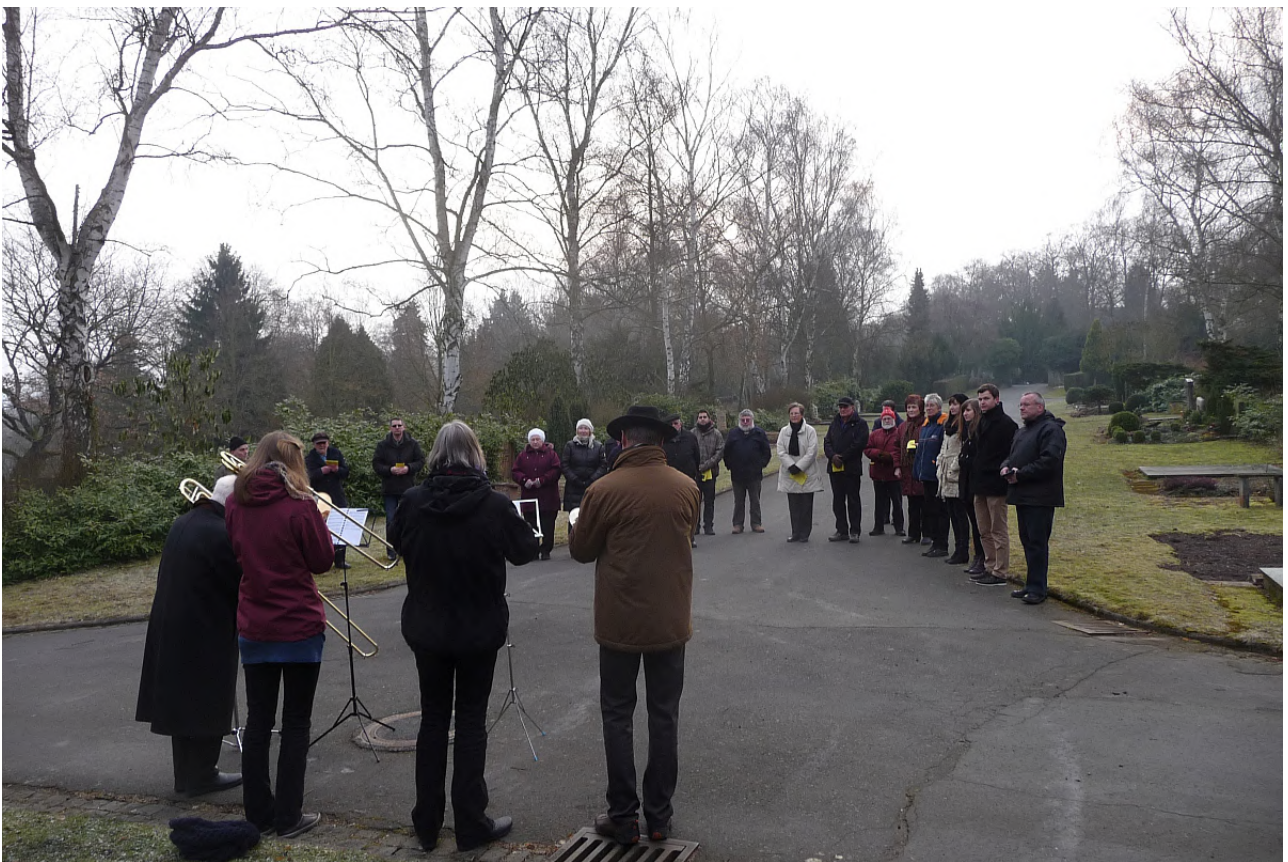
Von Bläsern begleiteter Gesang gehört zur Osterandacht am Steinkreuz einfach dazu

„Ich will euch wiedersehen“, das ist das große tröstliche Versprechen, das Jesus all denen gibt, die auf ihn vertrauen. Die Hoffnung, einen Verstorbenen wiederzusehen, bedeutet aber eine Freude mitten im Leid. Die Traurigkeit wird nicht einfach beseitigt, Tränen werden dennoch geweint, die Klage um einen geliebten Menschen behält ihr Recht, die Trauer muss durchgestanden und bewältigt werden.