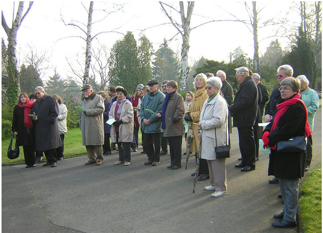
Teilnehmende an der Osterandacht 2007 auf dem Neuen Friedhof Gießen

haupten, wollen selber über Gut und Böse bestimmen. So kommt es, dass wir statt im Reich Gottes im Reich der Todesmächte leben. Tagtäglich geschieht der Sündenfall, tagtäglich essen wir vom Baum der Erkenntnis. Wir handeln egoistisch statt zu lieben. Wir tun einander weh, statt zu heilen. Wir sichern uns ab mit Zwang und Gewalt, statt Vertrauen aufzubauen zu denen, die uns fremd sind, die uns Angst machen und denen wir Angst machen. Wir resignieren vor Zuständen, die uns unüberwindlich erscheinen.