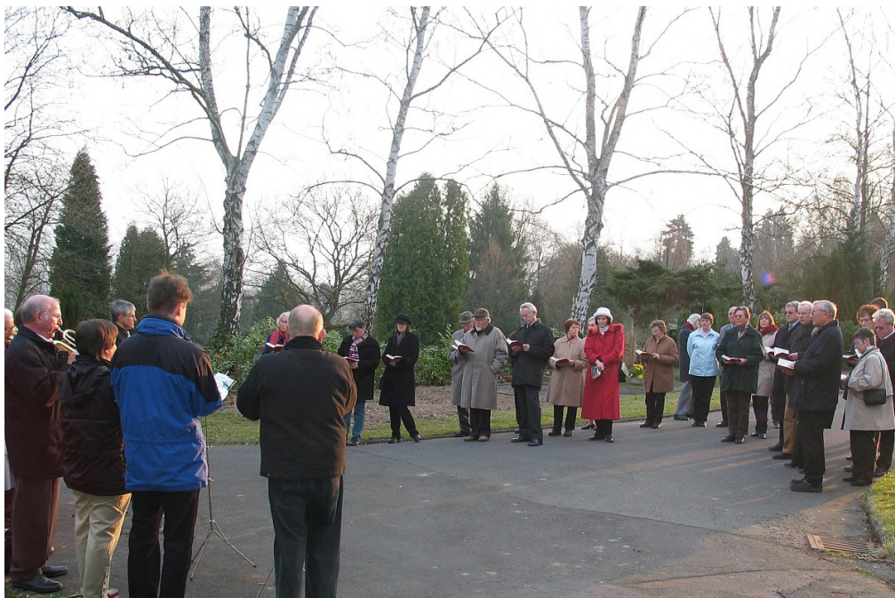
Teilnehmende an der Osterandacht 2005 auf dem Neuen Friedhof Gießen

Doch wie lange es auch dauert und an welche Orte sie sich verkrochen haben mögen, die Osterbotschaft erreicht sie doch. Sie erkennen Jesus zu Hause beim Brotbrechen oder während ihrer Arbeit beim Netzeauswerfen.