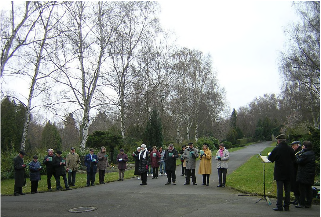
Teilnehmende an der Osterandacht 2008 am Steinkreuz auf dem Gießener Friedhof

2. Halt im Gedächtnis Jesus Christ, der für dich hat gelitten, ja gar am Kreuz gestorben ist und dadurch hat bestritten Welt, Sünde, Teufel, Höll und Tod und dich erlöst aus aller Not; dank ihm für diese Liebe!