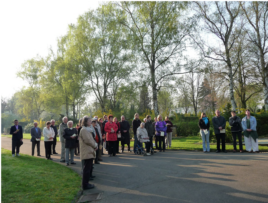
Teilnehmende an der Osterandacht um 8.00 Uhr am Steinkreuz

evangeliums dauert es, bis die Jünger endlich glauben. Den Frauen glauben sie nicht. Den Jüngern von Emmaus glauben sie nicht. Erst als der Auferstandene selbst ihnen als lebendig erscheint, fassen sie neues Vertrauen.