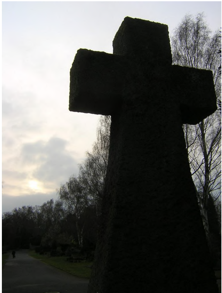
Steinkreuz im Gegenlicht der aufgehenden Sonne

Jetzt wird es endlich Ostern in unserem Lied. Mir fällt auf, dass das Wort Not sich wiederholt: die Erlösung aus der Not, die Jesus am Kreuz in die Wege leitet, kommt in der Auferstehung zu ihrem Ziel. Er ist befreit aus seiner Not, aus seiner Plage, er hat den Sieg über den Tod errungen. Für uns bleibt zu bedenken, was das für uns bedeutet. Dem Dichter sind zwei Stichworte wichtig, Frieden und Leben: „Bedenke, dass er Fried gemacht, sein Unschuld Leben wiederbracht.“ Ostern ist der Beginn des Friedens in jeder Beziehung: Versöhnung mit Gott, Überwindung der Feindschaft zwischen Menschen, Bewältigung der inneren Zerrissenheit in unserer eigenen Seele. Ohne solchen Frieden ist letzten Endes kein wirkliches Leben möglich; ohne inneren und äußeren Frieden bleibt unser Leben bedroht, unerfüllt, in ängstlicher Unruhe gefangen. Aber nun hat Jesus uns das „Leben wiederbracht“, das verloren war.