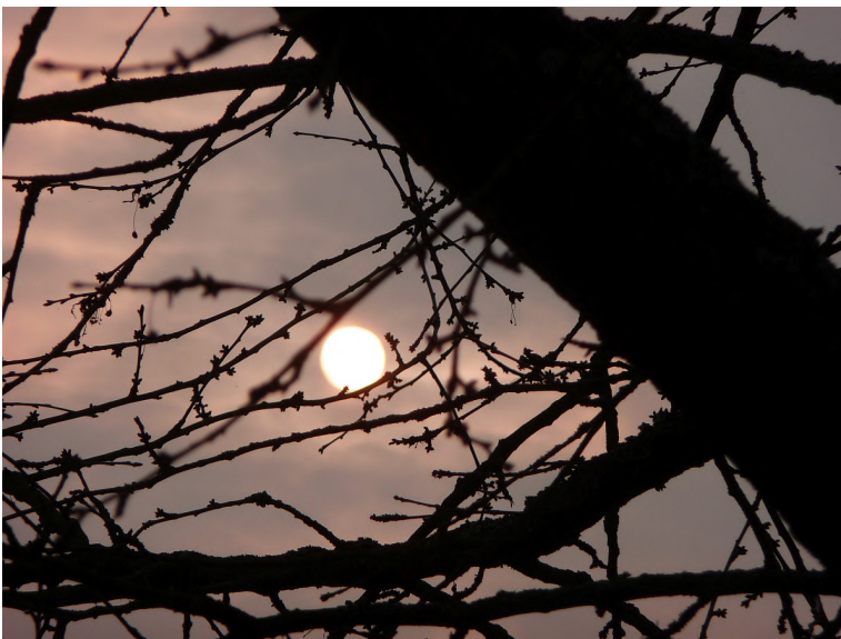
Das Licht der Ostersonne scheint durch dunkle Wolken

und eure Freude soll niemand von euch nehmen.