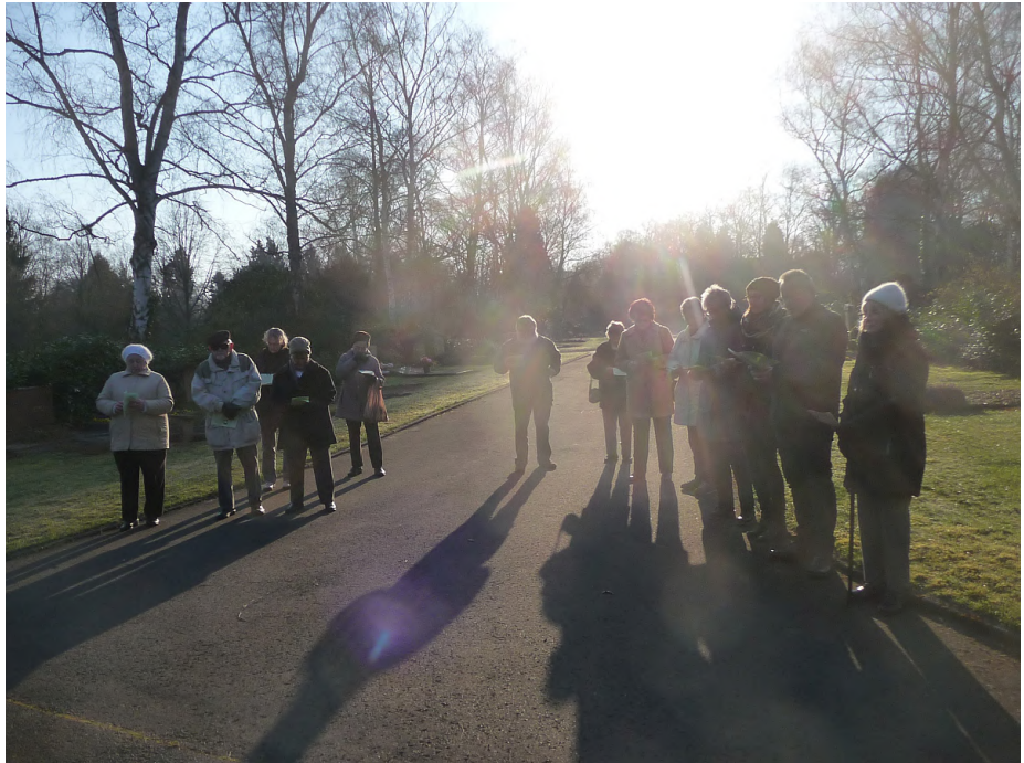
Teilnehmende an der Osterandacht 2015 im Licht der Morgensonne

Zuvor singen wir einige Strophen aus dem Lied 111 . In ihnen geht es darum: nicht nur die Auferstehung Jesu selbst ist ein Wunder, sondern es ist auch ein Wunder, wenn es bei uns Ostern wird, also wenn wir selber von der Osterbotschaft ergriffen werden und nicht nur von Zweifel oder Entsetzen: