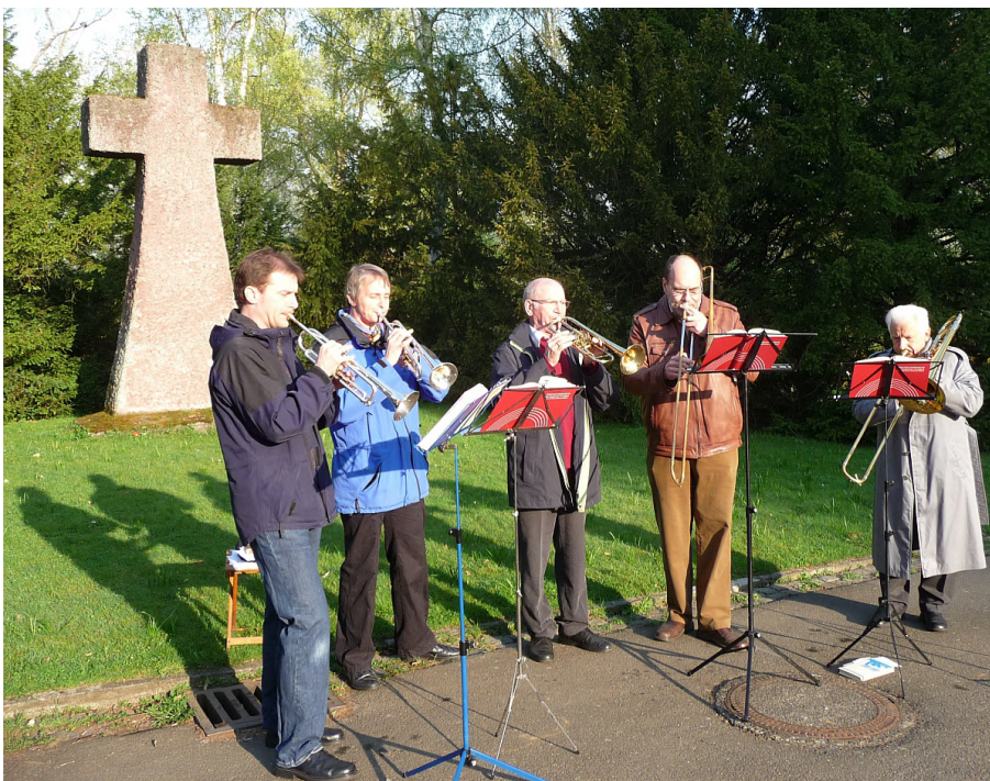
Bläserkreis am Steinkreuz auf dem Neuen Friedhof in Gießen

Vielleicht wollte Markus nicht vorschnell jubeln. In unserer Welt wird der Sohn Gottes bis heute getötet in jedem Menschen, der verhungert, und Jesus leidet mit in jedem Kind, das gequält wird. Wenn dieser Gequälte, Gekreuzigte, Begrabene auferstanden ist und vor uns hergeht nach Galiläa, also dorthin, wo unser Alltag stattfindet, dann erwartet er dort unseren Aufstand gegen alle Todesmächte.