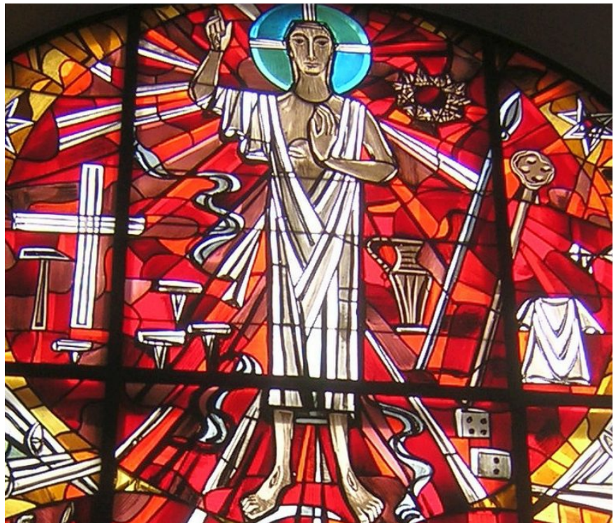
Kreuz, Hammer und Nägel, Dornenkrone und Wasserkrug des Pilatus, Lanze, Essigschwamm, Würfel und Gewand – die Werkzeuge des Karfreitag im Hintergrund des auferstandenen Christus auf dem Altarfenster der Pauluskirche

Eine andere Gruppe von Menschen tritt ins Blickfeld. Die Befehlsempfänger, die den schmutzigen Job der Kreuzigung erledigen müssen. Römische Söldner werden nicht üppig entlohnt, darum halten sie sich schadlos an der Nachlassenschaft eines Verurteilten. Jesus hat nicht mehr als die Kleider an seinem Leib. Die vier Wachmänner würfeln um das Gewand Jesu und wissen gar nicht, dass sie damit ein Wort der Bibel wahr machen, aus dem Psalm 22, den wir vorhin gebetet haben: „sie teilen sich meine Kleider, über mein Gewand werfen sie das Los“. Sie wissen buchstäblich nicht, was sie tun, aber für Johannes ist wichtig: Was sie tun, kann die Pläne Gottes letzten Endes doch nicht vereiteln. Was sie tun, vernichtet ein Menschenleben. Aber es vernichtet nicht die Liebe dieses Gottes und nicht die Kraft des Lebens selbst, die von Gott ausgeht.