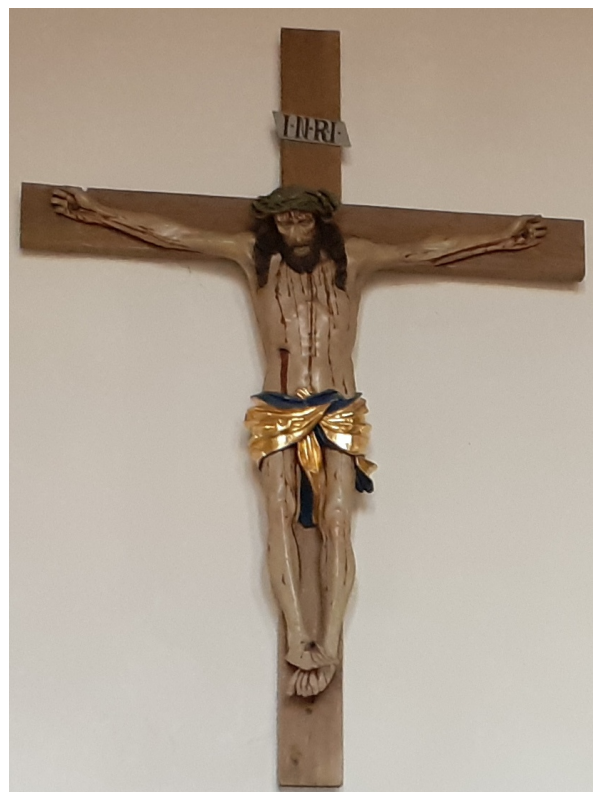
Das Kruzifix an der Rückwand der evangelischen Kirche in Reichelsheim/Wetterau

Andere Christen machen sich gar nicht viele Gedanken um das Leiden und das Kreuz Jesu, für sie ist wichtiger, was Jesus gesagt und getan hat, dass er Arme und Ausge-