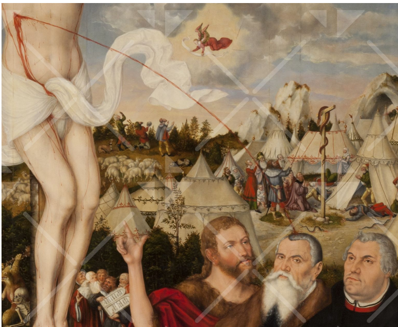
Das Blut aus der Seitenwunde Jesu spritzt auf den Kopf von Lucas Cranach

Und so sieht man auf der linken Seite den alten Adam, den sündigen Menschen, mit erhobenen Armen tanzen und springen und direkt ins Höllenfeuer hineinlaufen. Rechts von ihm sieht man den Tod; läuft er vor ihm weg oder tanzt er mit ihm? Im Hintergrund sieht man eine phantastisch anmutende Gestalt, halb Tier, halb Mensch, dämonisch, wollüstig, sie deutet an, in welche Gefangenschaft der Begierden der Mensch sich verstrickt, der aus dem Vertrauen zu seinem Schöpfer herausfällt.