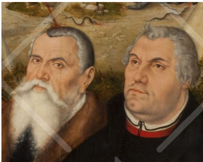
Lucas Cranach und Martin Luther

Schauen wir etwas tiefer, so sehen wir nicht nur, dass die beiden Männer der beginnenden Neuzeit im Gegensatz zu Johannes dem Täufer Beinkleider tragen und sich dennoch eng mit ihm verbunden wissen, sondern auch, dass der Täufer nicht nur mit seiner rechten Hand zum Gekreuzigten zeigt, sondern auch mit seiner linken zu einem Schaf, das vor ihm steht und wie zum Gruß ein Vorderbein erhebt. Hier erinnert der Maler an das Wort von Johannes dem Täufer ( Johannes 1, 29 ):