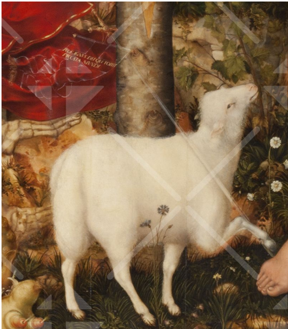
Das Lamm mit der Siegesfahne

gödie, sondern ein zwar trauriges Geschehen, das aber dennoch allen Menschen Heil gebracht hat: die Errettung von Sünde und ewigem Tod.