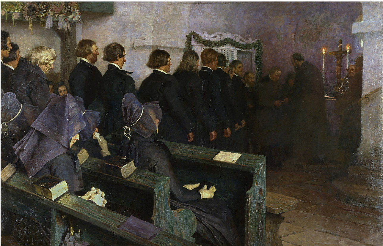
Bild: Carl Ludwig Noah Bantzer artist QS:P170,Q878161, Carl Bantzer – Abendmahlsfeier in Hessen (1892) , als gemeinfrei gekennzeichnet, via Wikimedia Commons

Auffällig sind neben der einheitlichen Kleidung der Frauen in ihrer Schwämer Abendmahlstracht auch die Gesichter der Menschen. Diese wirken auf mich recht schuldbewusst oder zumindest demütig.