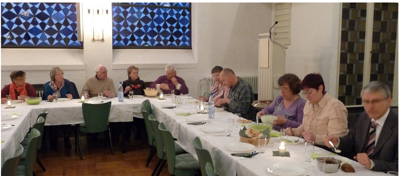
Das Grüne-Soße-Essen findet seit Jahren an Tischen vor den Altarstufen der Pauluskirche statt

deines Sohnes Jesu Christi, unseres Herrn. „Amen.“