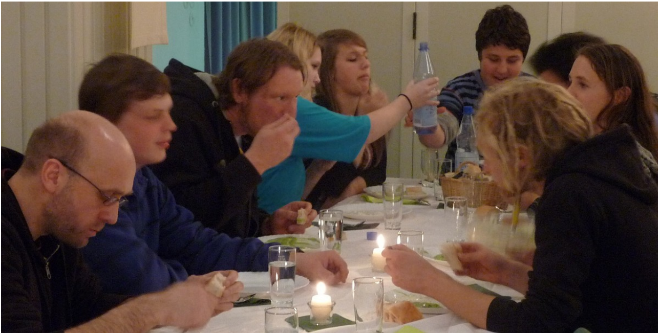
Mitglieder der Capoeira-Gruppe, die seit Jahren den Gemeindesaal des Pauluszentrums für ihr Training nutzen darf, beim Grüne-Soße-Essen am Gründonnerstag 2012

Wir hören die Schriftlesung aus dem Evangelium nach Lukas 14, 16-17 und 21-23 . Jesus erzählt ein Gleichnis von der Art und Weise, wie Gott die Menschen zu sich einlädt: