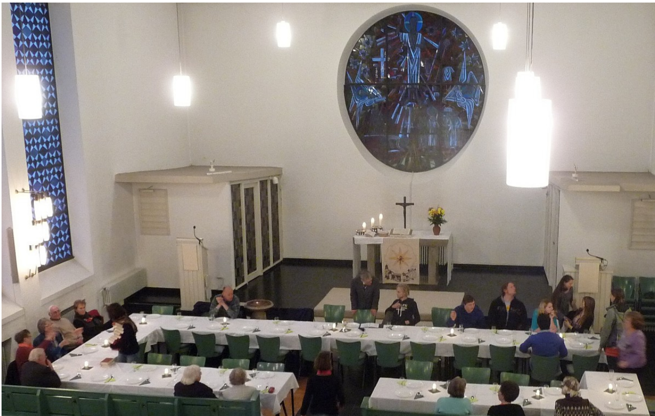
Grüne-Soße-Essen am Gründonnerstag 2012 nach dem Tischabendmahl (alle Fotos wurden nicht während des Gottesdienstes, sondern beim anschließenden Essen aufgenommen)

Wir sind hier versammelt, wie die Jüngerschaft Jesu versammelt war, bevor die unfassbaren Ereignisse begannen, die im Mittelpunkt unseres christlichen Glaubens stehen. Wir sitzen zusammen und denken daran, wie Jesus mit den ihm vertrauten Menschen ein letztes Mal zusammen saß, bevor er Angst ausstand im Garten Gethsemane, gefangengenommen und zur Verurteilung geschleppt wurde. Nur eine Nacht trennt uns von der Folter, die Jesus auf sich nahm, von Schlägen und Verspottung, von der Kreuzigung und seinem Tod. Morgen Abend schon wird Jesus ins Grab gelegt sein.