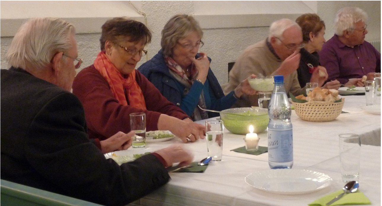
Drei Ehepaare am Tisch der Paulusgemeinde beim Grüne-Soße-Essen

Wir gedenken gerade heute an das letzte Mahl Jesu mit seinen Jüngern, er hat es mit ihnen gefeiert, auch um sie auf das kommende Leid vorzubereiten und ihnen die Angst zu nehmen. Seine Liebe ist stärker als der Tod.