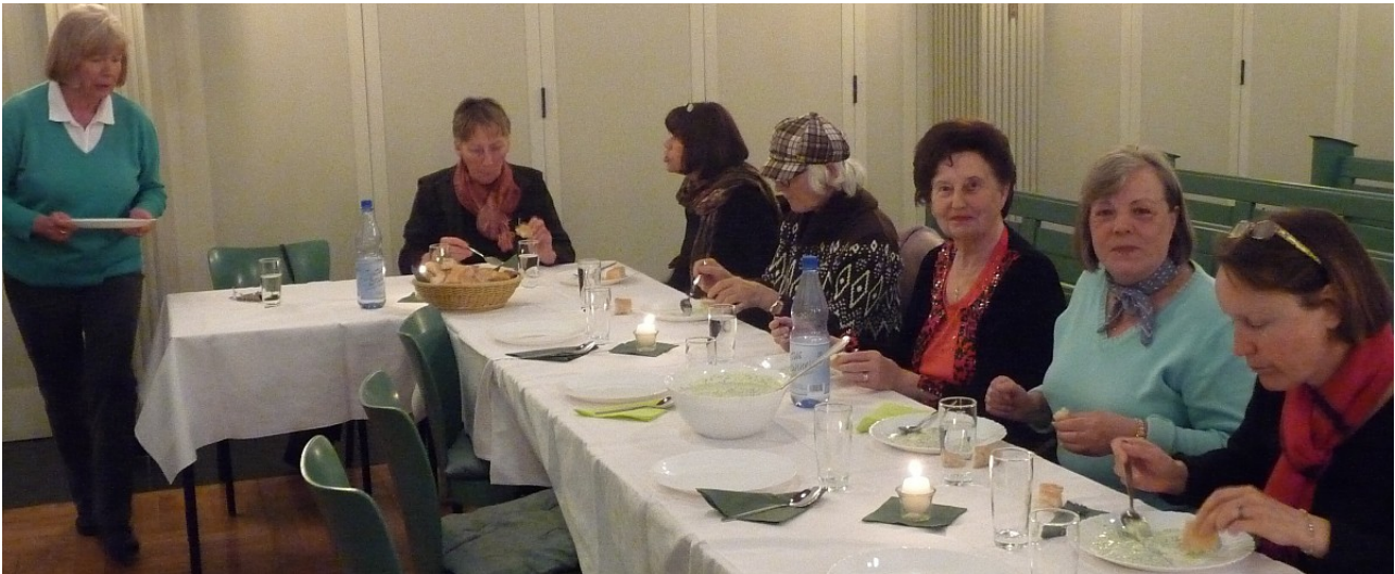
Kirchenvorsteherinnen und Mitglieder des Paulustreffs beim Grüne-Soße-Essen

Wir danken dir für die Gemeinschaft, die wir heute Abend haben.