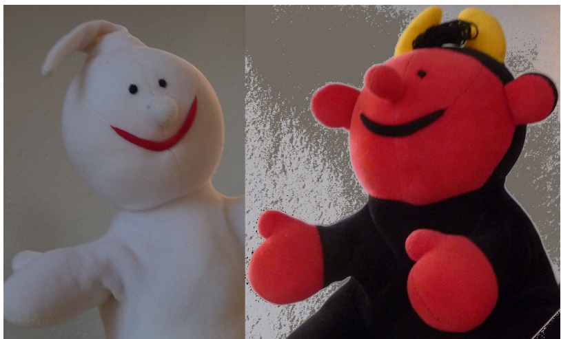
Die Handpuppen Gabi und Lutz, die Pfarrer Schütz bei seinen Andachten im Kindergarten unterstützen

Fischli: Das Bild ist wirklich ein bisschen komisch und auch ein bisschen gruselig. Wollt ihr dazu eine Geschichte hören?