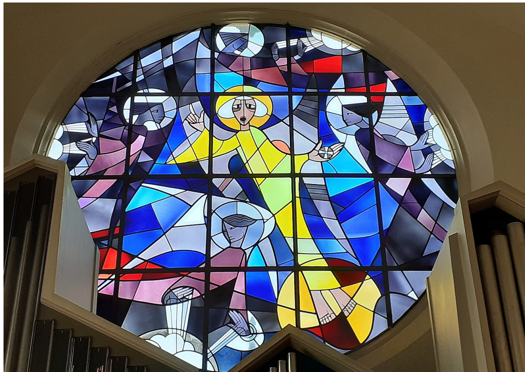
Die vier Winde werden von Engeln festgehalten – ein Fensterbild in der evangelischen Johanneskirche Gießen

versichert: auch wenn wir uns den Gewalten der Natur ausgeliefert fühlen, Gottes Macht ist größer und umgreift alles. Wenn Gott seinen besonderen Engel aufsteigen lässt wie die Morgensonne, hören die Engel der Winde auf seine Stimme und bewahren die menschliche Umwelt bis auf Weiteres vor der totalen Zerstörung. Bis wann? Bis der fünfte Engel eine andere Aufgabe zu Ende gebracht hat, nämlich die Menschen, die Gott treu gedient haben, mit einem Siegel