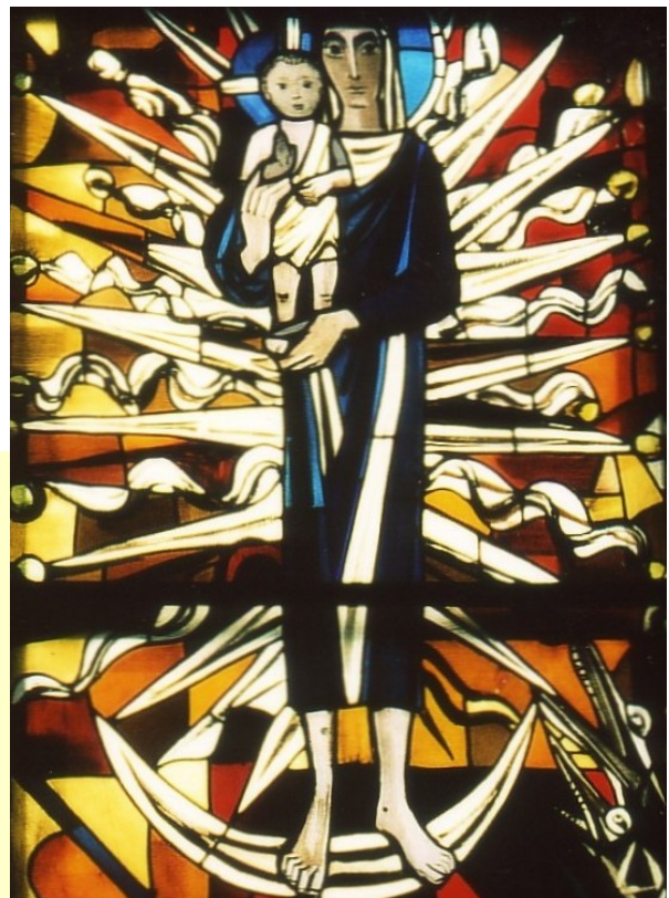
Maria mit dem Kind als Himmelskönigin mit zwölf Strahlen umstrahlt, auf der Mondsichel stehend, auf dem Emporenfenster der Evangelischen Pauluskirche Gießen

1 Und es erschien ein großes Zeichen am Himmel: eine Frau, mit der Sonne bekleidet, und der Mond unter ihren Füßen und auf ihrem Haupt eine Krone von zwölf Sternen. 2 Und sie war schwanger und schrie in Kindsnöten und hatte große Qual bei der Geburt. 3 Und es erschien ein anderes Zeichen am Himmel, und siehe, ein großer, roter Drache, der hatte sieben Häupter und zehn Hörner und auf seinen Häuptionen sieben Kronen, 4 und sein Schwanz fegte den dritten Teil der Sterne des Himmels hinweg und warf sie auf die Erde. Und der Drache trat vor die Frau, die gebären sollte, damit er, wenn sie geboren hätte, ihr Kind fräße. 5 Und sie gebar einen Sohn, einen Knaben, der alle Völker weiden sollte mit eisernem Stabe. Und ihr Kind wurde entrückt zu Gott und seinem Thron.