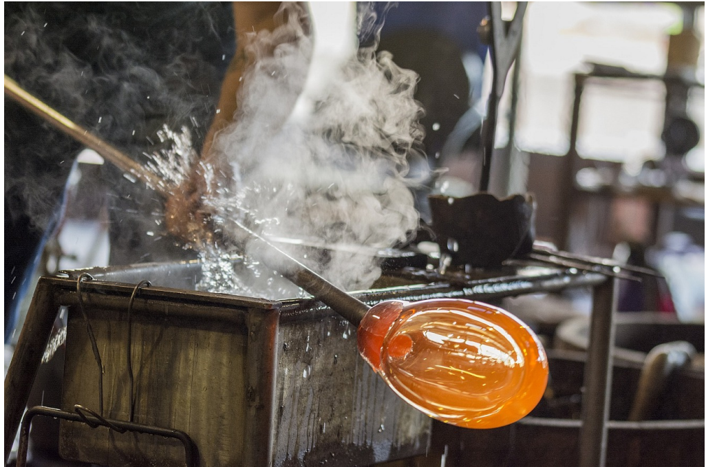
Wie Feuer und Glas zusammenwirken, sieht man in einer Glasbläserei

Aber Glas und Feuer, das geht wohl zusammen. Ich war einmal in einer Glasbläserei, das ist 22 Jahre her, da war ich noch Schüler, da habe ich gesehen, wie aus einem Klumpen von heißem, glühendem Glas bestimmte Formen geblasen wurden: Trinkgläser, Vasen, Flaschen und vieles mehr. Glas kann, wenn es sehr heiß wird, flüssig werden, und das geht nur mit Feuer, mit einem sehr heißen Feuer.