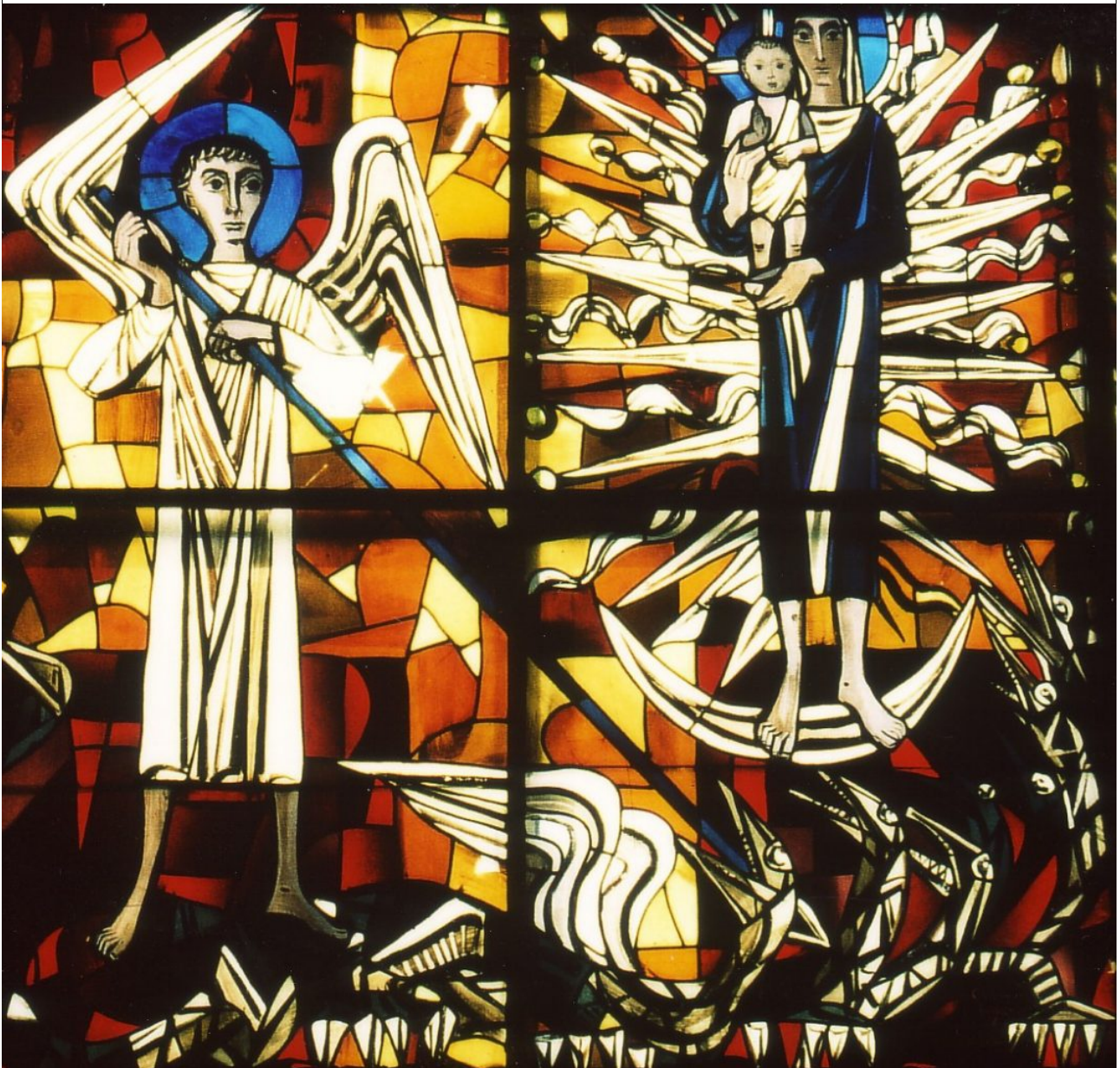
Das Westfenster über der Empore der evangelischen Pauluskirche Gießen

Finden wir uns in der Frau wieder, die ein Bild für die Gemeinde Christi ist, dann tragen wir Christus: Wir sind gehalten, indem wir Jesu geringste Geschwister auf den Armen tragen. Identifizieren wir uns mit dem Erzengel Michael, dann weisen wir das Böse in dieser Welt gelassen in seine Schranken. Denn der Drache ist bereits besiegt.