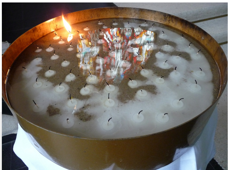
Im Kerzenwachs spiegelt sich das Altarfenster der Pauluskirche mit der Darstellung des Auferstandenen

Was wird sein nach dem Sein? Ob es weint oder lacht? O, ich wünsch mir, dass es lacht, selbst in der finstersten Nacht.