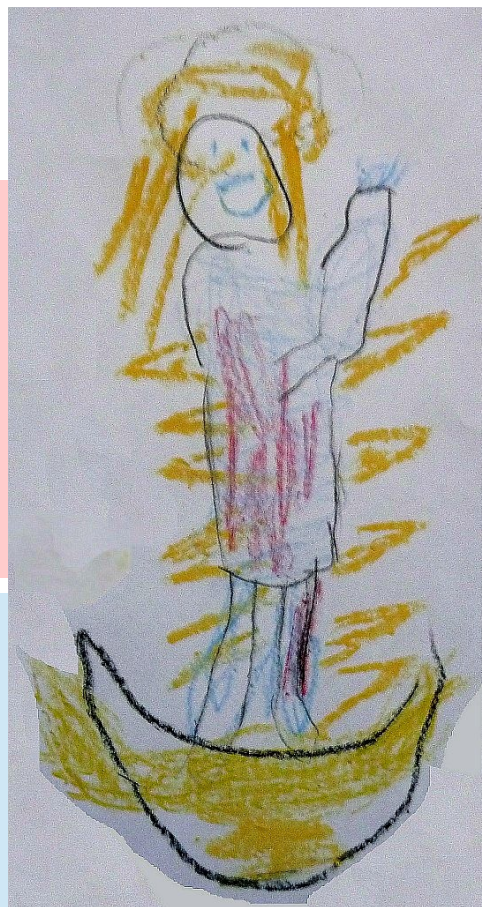
Maria als Himmelskönigin auf einem von den Konfis gemalten Bild

Dazu kann ich wieder nur sagen: Was ich gesehen habe, ist die Wahrheit hinter den Dingen. Vielleicht kann man auch sagen: die Wahrheit, die tief in der Seele der Menschen verborgen liegt. Maria wurde schwanger, kein Mensch weiß genau, wie, und sie nahm ihr Kind von Gott an als ein heiliges Kind, das Gottes Liebe in die Welt bringen sollte. Ist das nicht genug, um sich Maria wie die wunderbarste Königin der Welt vorzustellen?