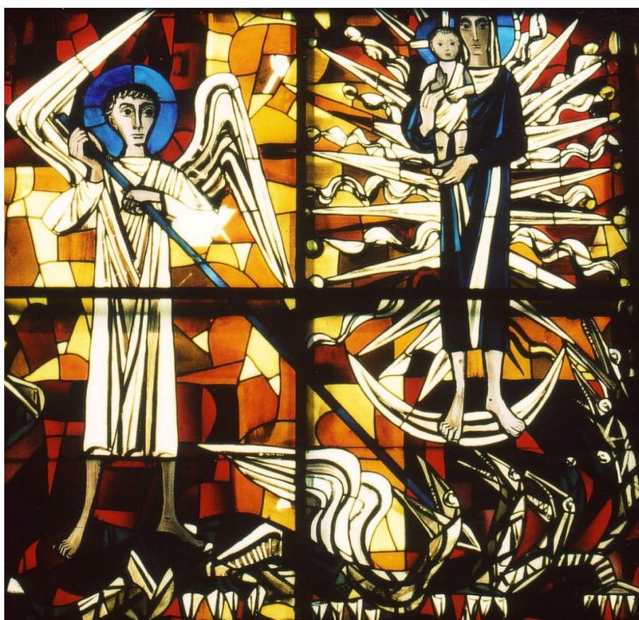
Das Westfenster in der evangelischen Pauluskirche Gießen mit dem Erzengel Michael, der den Drachen besiegt, und der Himmelskönigin mit dem Kind auf dem Arm

Liebe Kolleginnen und Kollegen, heute halte ich die Andacht einmal in unserer Pauluskirche. Dass wir mit dem Rücken zum Altar sitzen, hat den Grund, dass ich gemeinsam mit Ihnen und euch unser Westfenster oberhalb der Empore betrachten möchte. Es fühlt sich ein wenig stiefmütterlich behandelt, denn als Ausgang aus der Kirche nutzen wir normalerweise den Gemeindesaal, wo wir zum Kirchencafé einladen. Claus Wallner hat dieses Fenster vor 54 Jahren geschaffen.