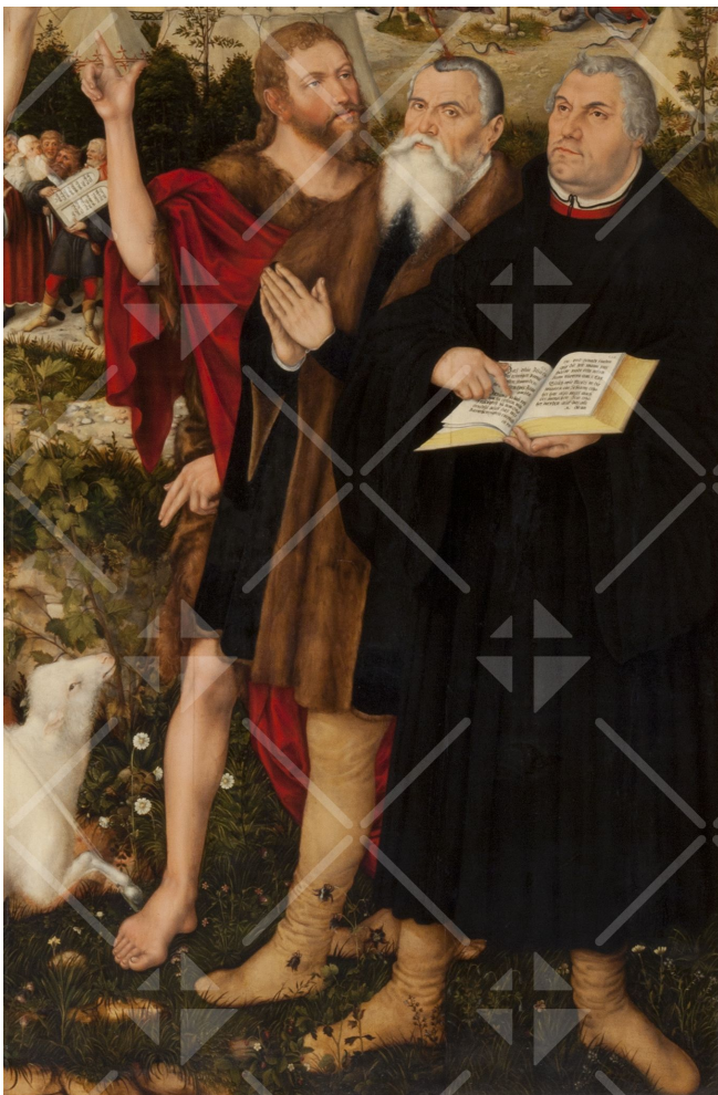
Die Hand des Täufers zeigt auf ein Lamm

Und warum steht Martin Luther neben ihm? Weil er es ist, der ganz ähnlich wie Johannes der Täufer sein ganzes Leben der Aufgabe gewidmet hat, auf die Bedeutung des Gekreuzigten für die Menschen hinzuweisen.