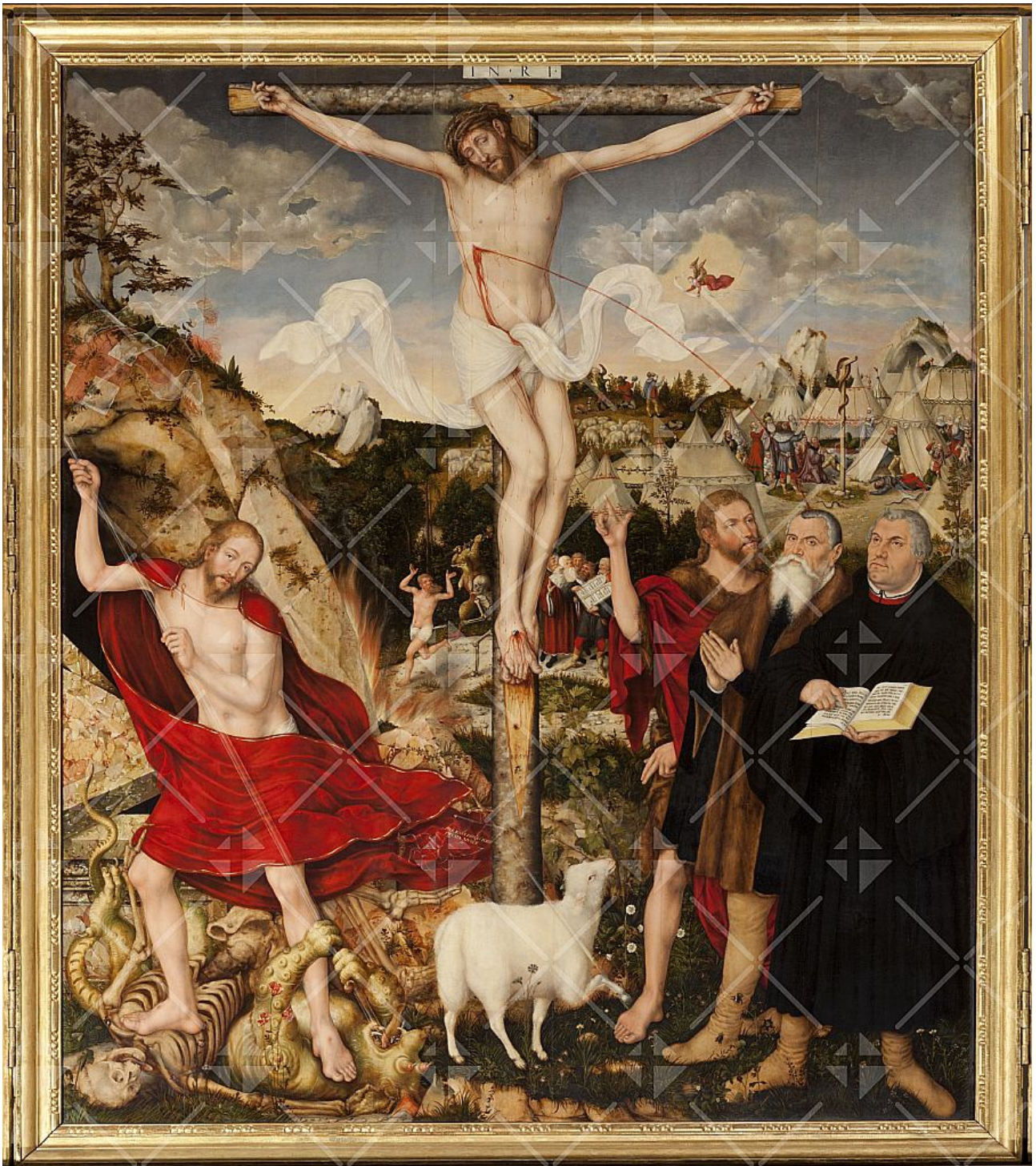
Cranach-Altar in der Stadtkirche St. Peter und Paul (Herderkirche) Weimar (es folgen nur Ausschnitte aus diesem Bild)

Beginnen wir mit den beiden Personen, die zeitlich überhaupt nicht in das Geschehen der Kreuzigung und Auferstehung Jesu hineinpassen: Lucas Cranach und Martin Luther. Hat der Maler sich selbst verewigen wollen, aus Eitelkeit? Hat er Martin Luther als evangelischem Helden ein Denkmal setzen wollen? Beides nicht mit bewuss-