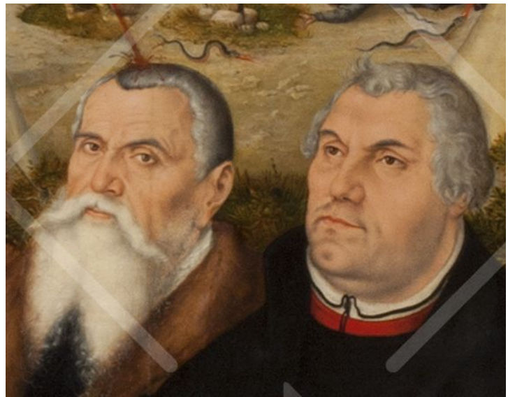
Lucas Cranach und Martin Luther

Schauen wir etwas tiefer, so sehen wir nicht nur, dass die beiden Männer der beginnenden Neuzeit im Gegensatz zu Johannes dem Täufer Beinkleider tragen und sich dennoch eng mit ihm verbunden wissen, sondern auch, dass der Täufer nicht nur mit seiner rechten Hand zum Gekreuzigten zeigt, sondern auch mit seiner linken zu einem Schaf, das vor ihm steht und wie zum Gruß ein Vorderbein erhebt. Hier erinnert der Maler an das Wort von Johannes dem Täufer ( Johannes 1, 29 ):