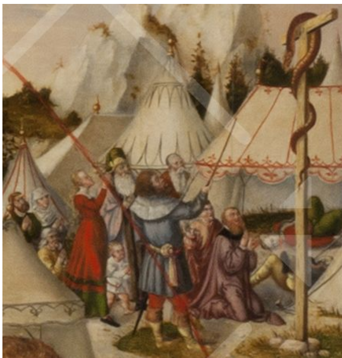
Die eherne Schlange an einem Kreuz

Oder verbrennen sie durch ihr Feuer die Seele dieses Menschen? Jedenfalls erinnern die feurigen Schlangen daran, dass Menschen, die ohne Gottvertrauen leben wollen, jederzeit Gefahr laufen, sich vor der Hölle fürchten zu müssen, vor einem Leben ohne Seele, ohne Sinn, ohne Liebe.