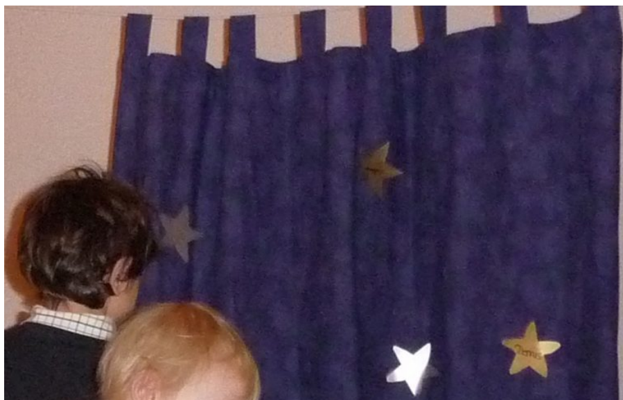
Wünsche der Kinder wurden im Familiengottesdienst auf Sternen an Tüchern im Altarraum befestigt

Liebe Kinder, liebe Konfis, liebe erwachsene Leute! Jetzt haben wir sehr viel von Wünschen gehört. Sachen, die man kaufen kann: LEGO-Steine, eine Puppenstube, Bücher, eine Gitarre; und anderes, was man nicht kaufen kann: freundliche Worte, ein ansteckendes Lächeln,