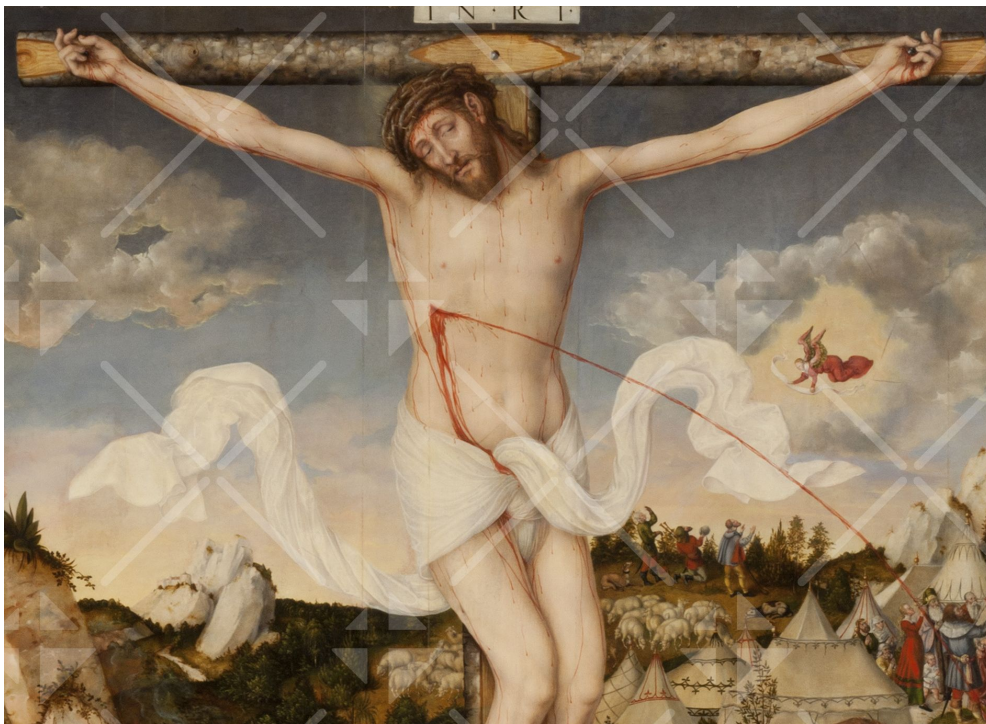
Jesus Christus hängt segnend und Gnade spendend am Kreuz

Der Gekreuzigte – auf dem Bild von Lucas Cranach sieht man sein Leiden, seine Schmerzen, Nägel, Dornenkrone, die Wunde, aus der das Blut spritzt. Aber das Leiden wird nicht übermäßig betont, er will nicht, dass wir uns an der Qual eines Menschen, wie sage ich es richtig, altdeutsch ergötzen oder neudeutsch aufgeilen. Deutlich wahrnehmen sollen wir, wie furchtbar die Folgen der Sünde sind; wer getrennt von Gott lebt, ohne Gottvertrauen, der schreit am Ende „Kreuzige ihn!“, der lässt seinen Freund im