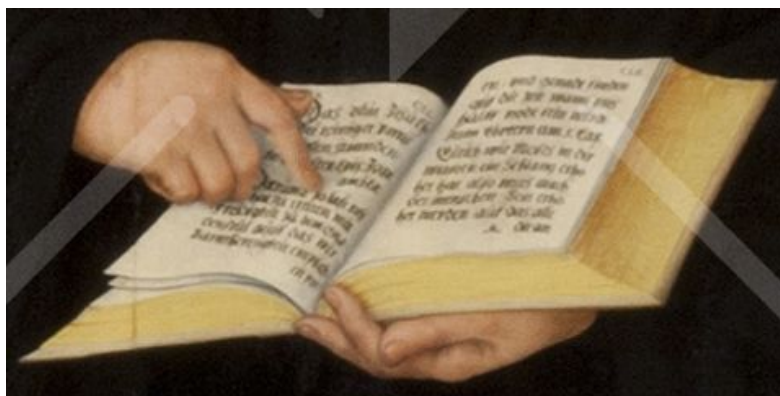
Die aufgeschlagene Bibel Martin Luthers

An dieser Stelle möchte ich einen Blick in das Buch werfen, das Martin Luther aufgeschlagen vor sich hält. Es ist die Bibel, und er zeigt auf drei Sätze, die das Geschehen am Kreuz für uns deuten. Der erste Satz steht in dem Brief 1. Johannes 1, 7 :