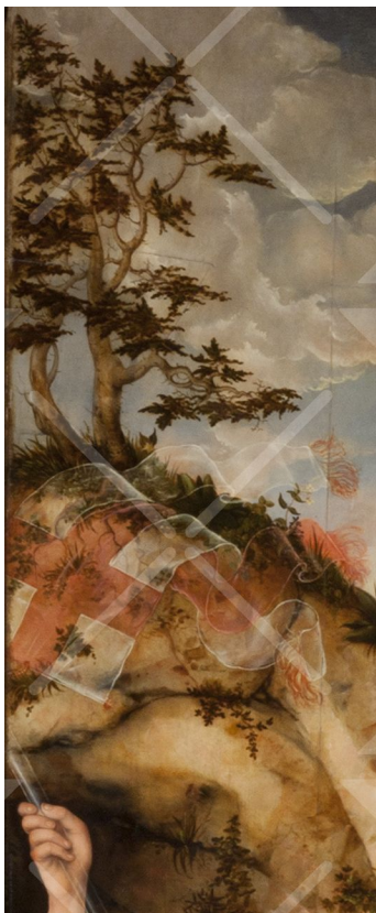
Leichentücher im Wind

Egal, jedenfalls ist Christus nicht mehr im Grab, sondern er ist als der Auferstandene damit beschäftigt, den Teufel zu besiegen. Lucas Cranach malt Jesus hier so ähnlich, wie auf unserem Fensterbild über der Orgelempore der Erzengel Michael dargestellt ist. Damit macht er deutlich: Wenn in der Offenbarung ein Engel den Satan besiegt, dann tut er das nicht aus eigener Kraft, sondern im Auftrag Gottes, der dem Teufel dadurch seine Macht nimmt, dass er sich aus Liebe für die Menschen hingibt und ihnen ihre Sünde vergibt. So gewalttätig es aussieht, wenn Christus in der Pose des Erzengels Michael den Satan mit einem Speer durchbohrt und tötet – diese Darstellung ist symbolisch gemeint. Der Speer ist nicht ohne Grund durchsichtig, wie ein Lichtschwert, er deutet an, dass Jesus den Teufel durchbohrt, indem er sich selbst durchbohren lässt, indem sein eigenes Blut vergossen wird.