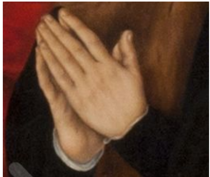
Die zum Beten zusammengelegten Hände des Malers Lucach Cranach

werfe ich in dieser Predigt auf die Hände des Malers Lucas Cranach. Er malt sie als betende Hände, zusammengelegt in dem Vertrauen, dass Gott in Jesus Christus für uns sündige Menschen alles getan hat, um uns zu erlösen, zu retten, zu befreien. Sein Bild will uns dazu anleiten, dasselbe wie er zu tun: dankbar anzuerkennen, was Gott durch das Leiden und Sterben seines Sohnes für uns getan hat, um uns zu einem Leben im Gottvertrauen und in tätiger Nächstenliebe zu befreien. Amen.