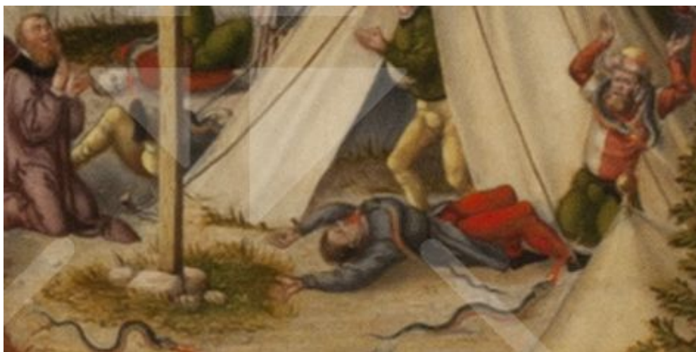
Eine Schlange speit einem, der auf dem Boden liegt, ihr Gift in den Mund.

Lucas Cranach malt diese Szene ziemlich gruselig, indem er darstellt, wie die Schlangen ihr Feuer in den Mund ihrer Opfer hineinspeien; fast sieht es aus, als ob die Schlangen hineinkriechen.