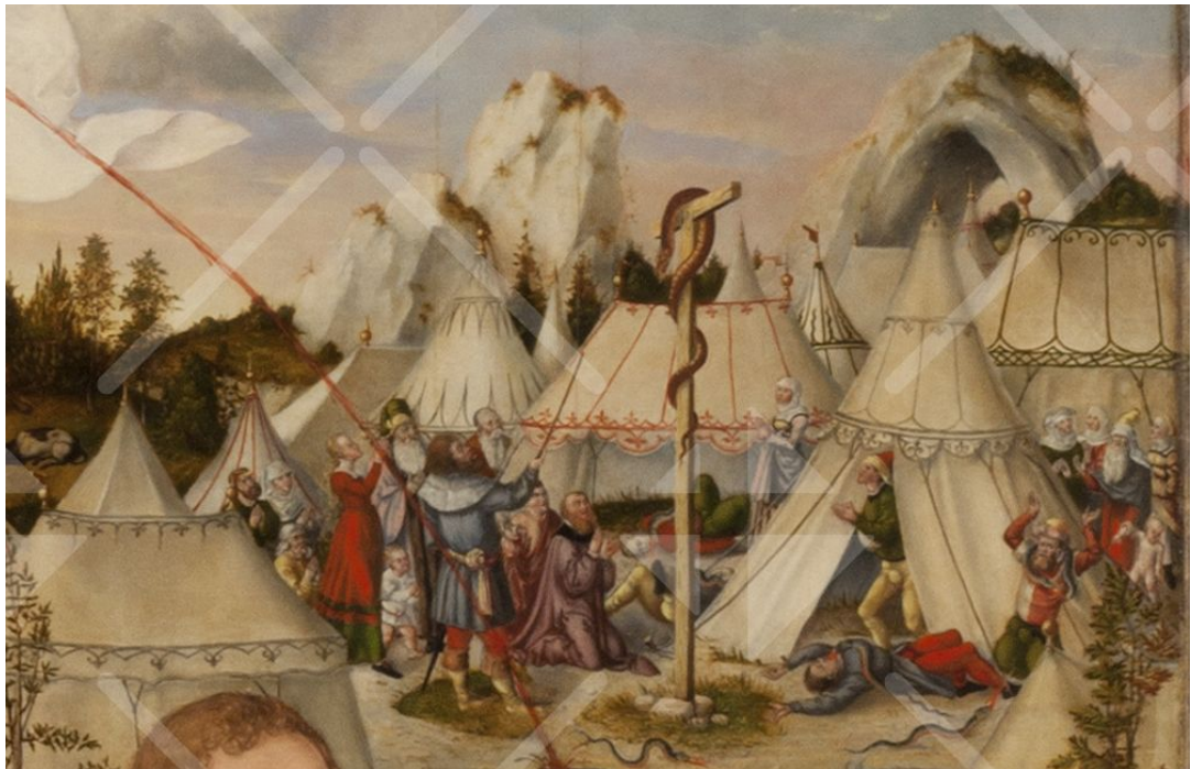
Gift und Feuer speiende Schlangen zwischen den Zelten Israels

Zwischen den Zelten Israels sieht man giftige Schlangen, vor denen