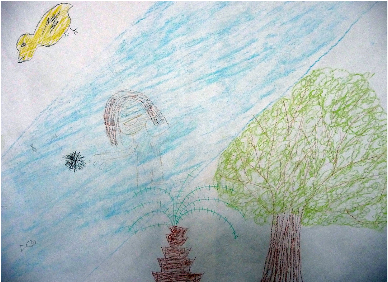
Johannes taucht Jesus im Jordan unter – auf dem Bild ist nichts von ihm zu sehen außer seinen schwarzen Haaren

Hier in der Kirche sagen wir: Gott ist heilig. Er ist wie ein Vater, der uns liebt, wie eine Mutter, die tröstet. Gott ist in Jesus selber auf die Erde gekommen, und Jesus will für uns da sein wie ein unsichtbarer Freund, ein großer Bruder. Gott ist heiliger Geist, eine Kraft, die heilig ist und uns innerlich stark macht.