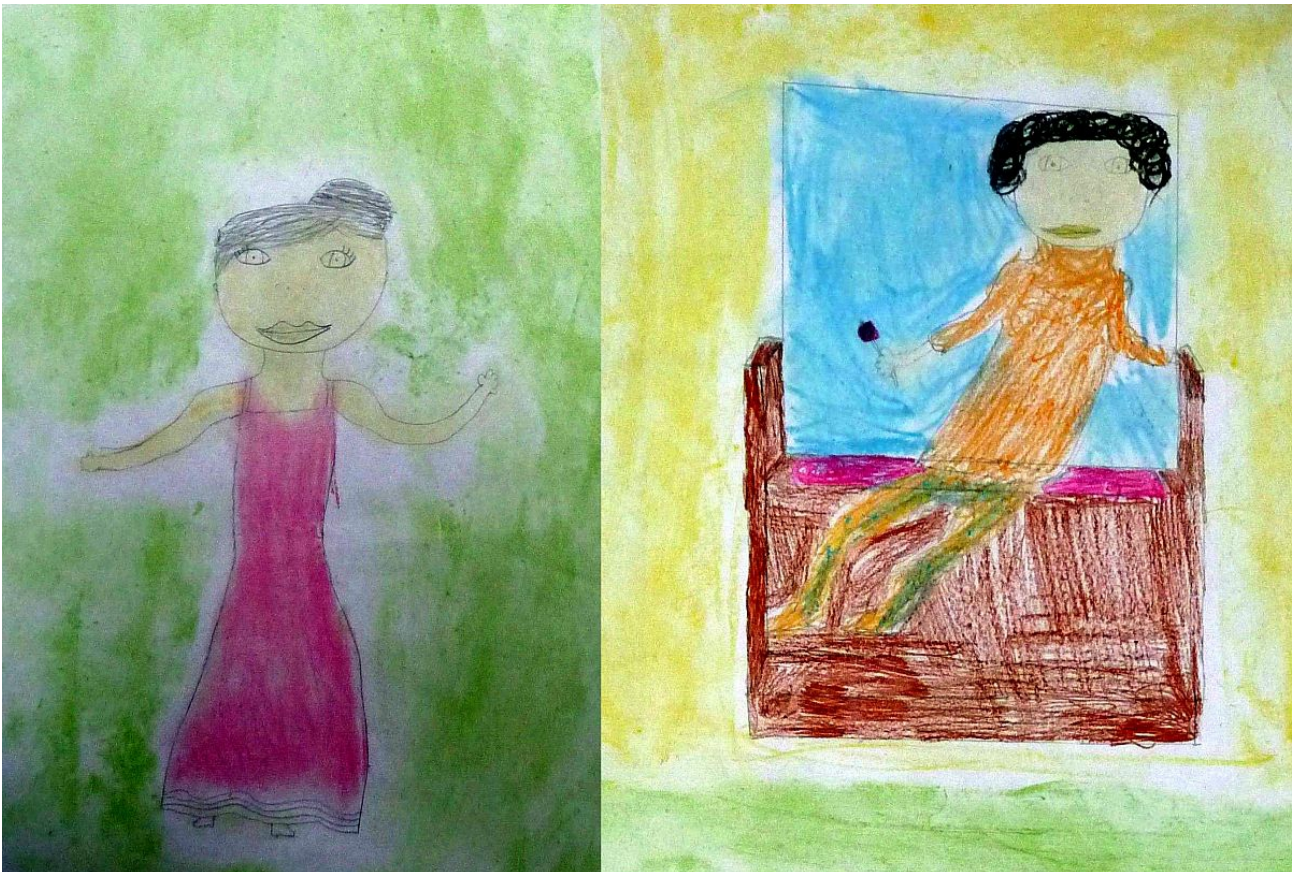
Salome tanzt vor ihrem Stiefvater Herodes

Gajus: Ihr wisst, König Herodes feiert oben im Palast seinen Geburtstag.