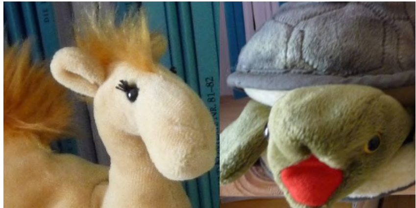
Das kleine Kamel Jamal und die uralte Schildkröte Zappi

Jamal: Salaam, Kinder, und wir sollen euch auch von Fischli, Lutz und Gabi grüßen. Lutz und Gabi hatten keine Lust, mitzukommen, weil sie lieber zusammen spielen wollen.