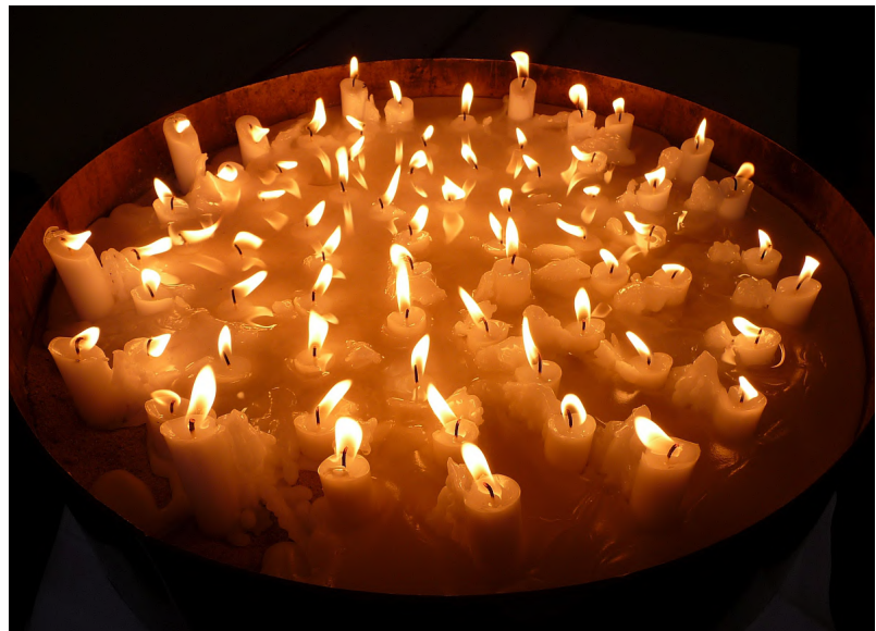
Kerzen für Verstorbene des vergangenen Kirchenjahrs

insgesamt 32 Verstorbene der Evangelischen Paulusgemeinde Gießen