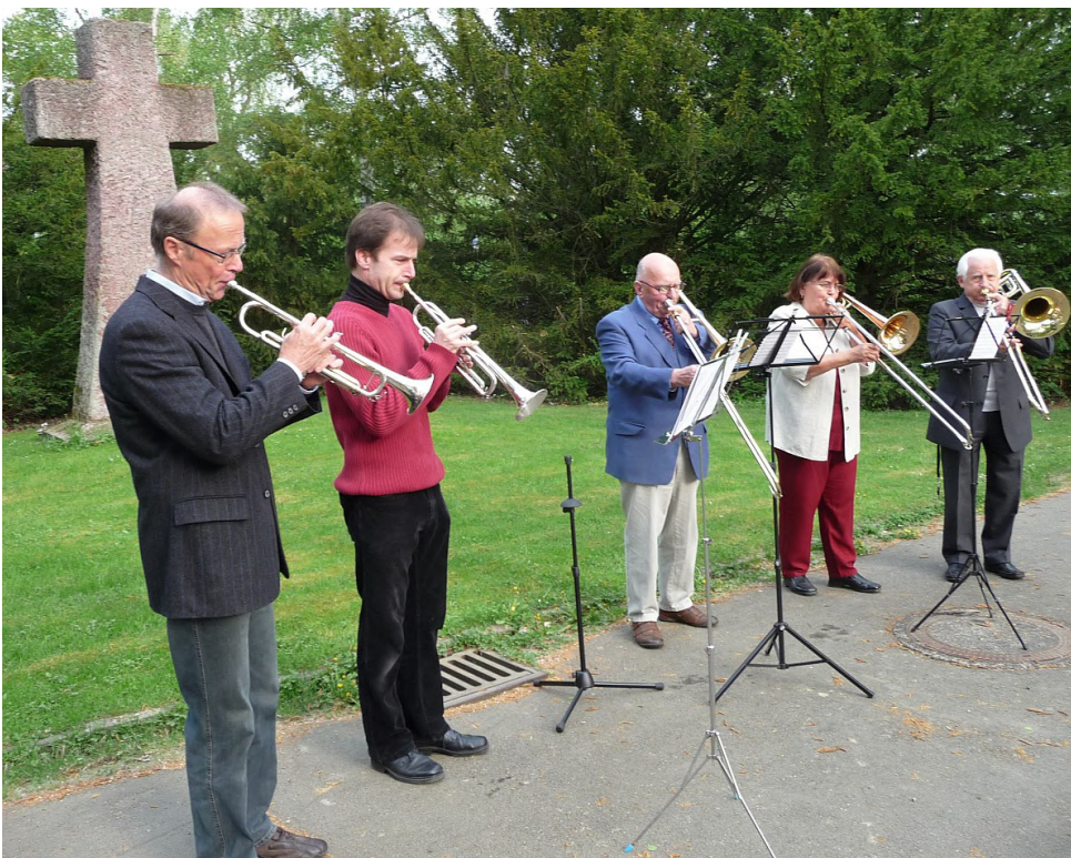
Kräftige Bläserbegleitung für den Gesang bei der Osterandacht

Um das Ende soll es in dieser Andacht gehen, das im Lied „selig“ genannt wird, das mit einem neuen, herrlichen Anfang zu tun hat, mit dem Eintritt in Gottes Ewigkeit. Auferstehung: Der Tod hat nicht das letzte Wort. Unrecht, Sünde, Verzweiflung sind überwunden durch die Liebe Jesu Christi. Wir leben in der Hoffnung auf unsere eigene Auferstehung von den Toten.