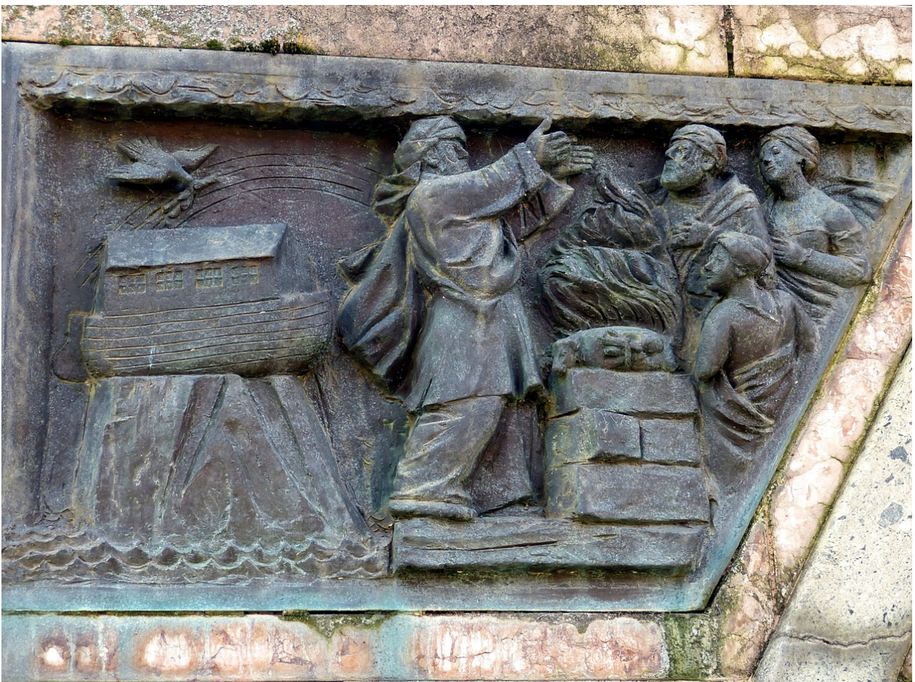
Noah und seine Familie bringen Gott nach der Sintflut ein Opfer dar

Gott kann den Noah gut riechen, weil er ein dankbarer Mensch ist. Nicht die gebratenen Opfertiere, sondern der Duft der Dankbarkeit selber steigt Gott so verführerisch in die Nase und verleitet ihn dazu, die Menschheit nicht aufzugeben, obwohl wir die Bosheit und Dummheit in unseren Reihen noch immer nicht überwunden haben.